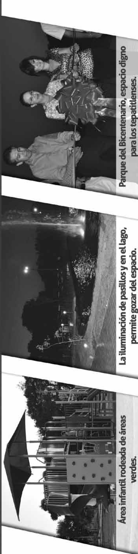
Área infantil rodeada de áreas verdes.

Ahora Sí, en tu espacio, puedes divertarte, entretenerte y disfrutar con tu familia momentos de calidad.