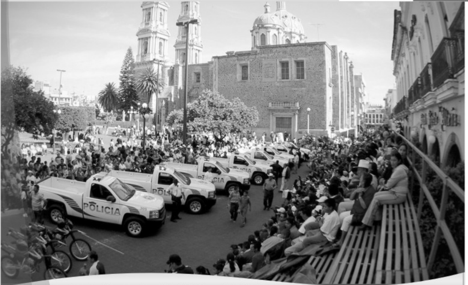
Entrega de patrullas para Seguridad Pública y Tránsito Municipal