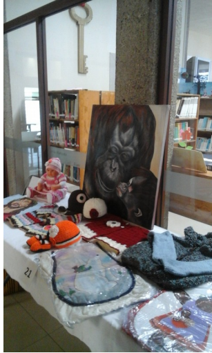
5.-MERCEDES ALDANA GUTIÉRREZ PINTURA AL OLEO