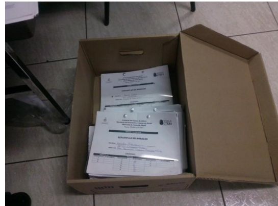
Sabanas (hojas que contenían la información de cada uno de los alumnos y la firma de recibido del Padre, Madre o tutor) y carátulas con la información de la escuela, la CCT, y el nombre del Director.