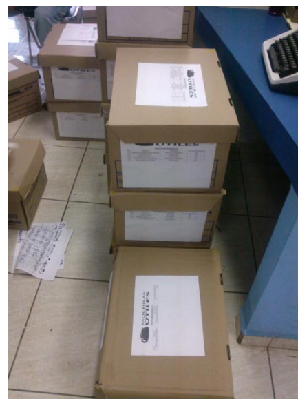
Cajas con documentos y carátulas de contenidos por sus 5 vistas.