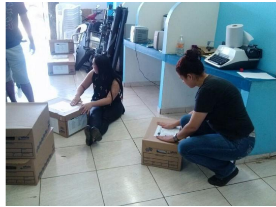
Paquetes con carátula, lista par realizar el conteo y hacer las 5 portadas de presentación de las cajas.