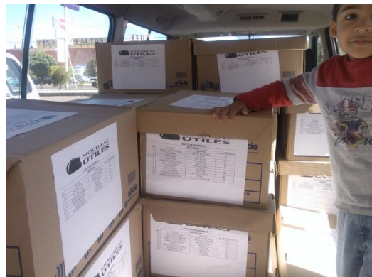
Cajas con documentos cargadas en el vehículo para salir a primera hora del lunes.