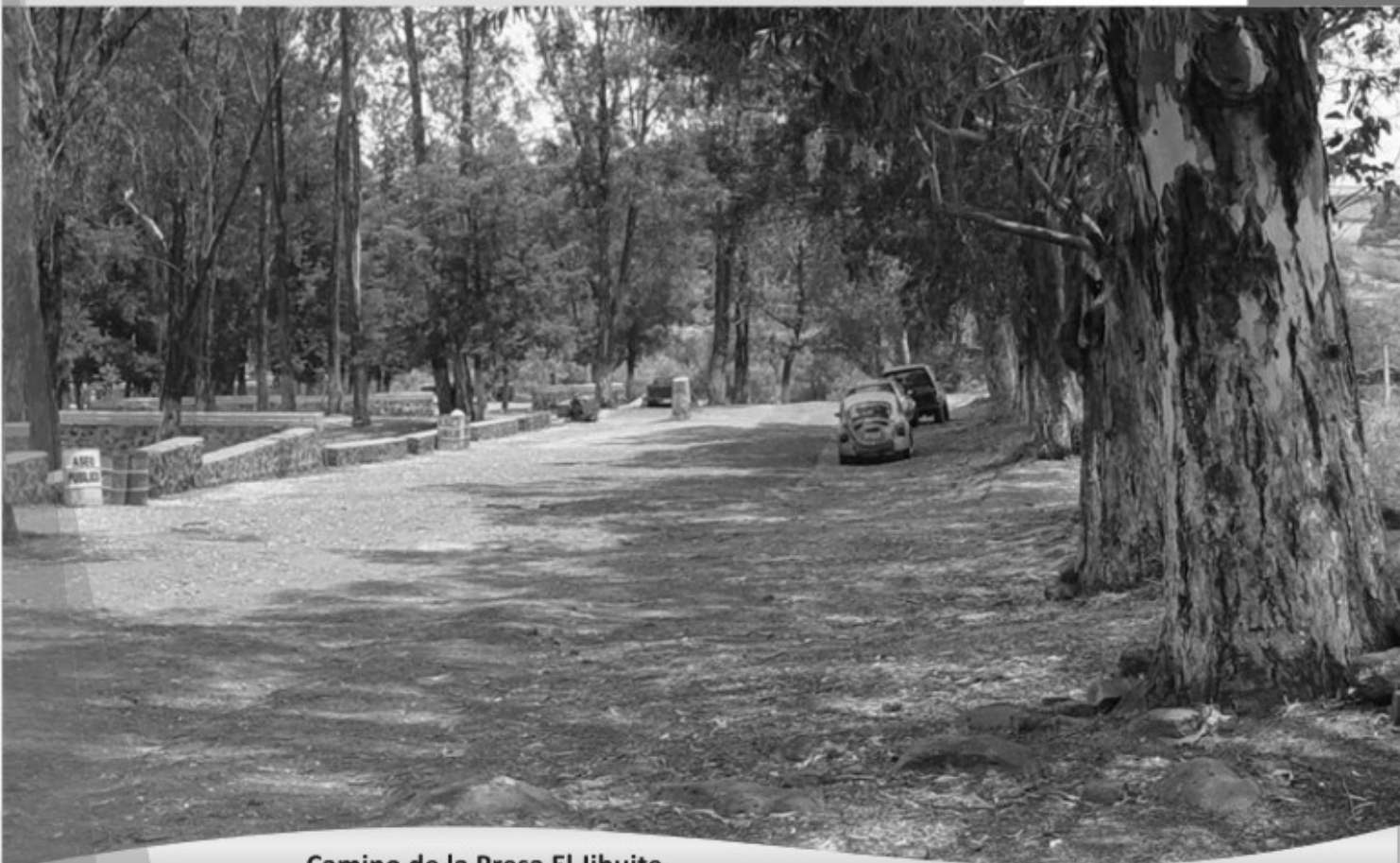
Camino de la Presa El Jihuite

Primera Edición: 6 de septiembre de 2005 (En la Gaceta No. 33)